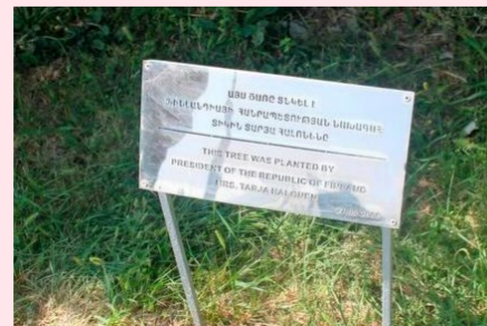
Kansanmurhamuseon pihassa on Tarja Halosen muistopuu kyltteineen.