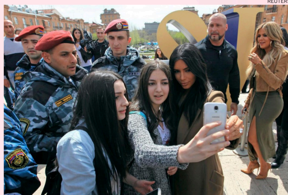
Sotilaat ja fanit ympäröivät Kim Kardashianin, kun hän vieraili Armeniassa 2015.