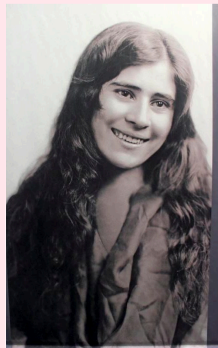
Aurora Mardiganian on armenialaisille tärkeä kansanmurhasta selviytymisen symboli. Hänet pakotettiin teini-ikäisenä seksiorjaksi, mutta hän pääsi pakenemaan Yhdysvaltoihin, jossa kirjoitti muistelmansa. Hänen muotokuvansa löytyy Kansanmurhamuseon seinältä.